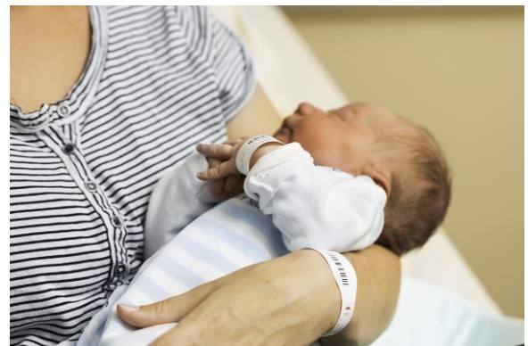
Einführung von Patientenidentifikationsarmbändern im KSOW (auch bei Säuglingen)